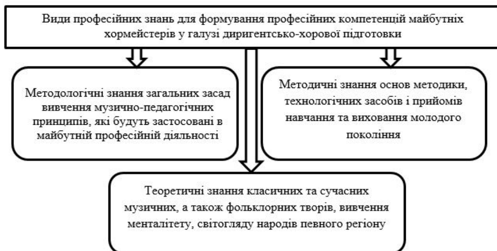
Рис. 1. Види фахових знань для набуття практичного досвіду в когнітивній діяльності майбутнього хормейстера

– формування навичок педагогічного контролю та діагностики (у процесі вокально-хорової діяльності в хормейстера розвивається вокальний слух, контроль за звуковисотною та ритмічною стороною музичного твору, вокальний стиль і принципи звукоутворення,