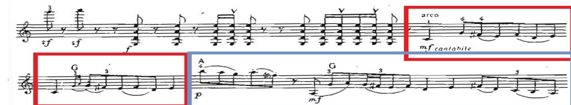
Рис. 3. Тематичний (другий) елемент першого розділу (початок)