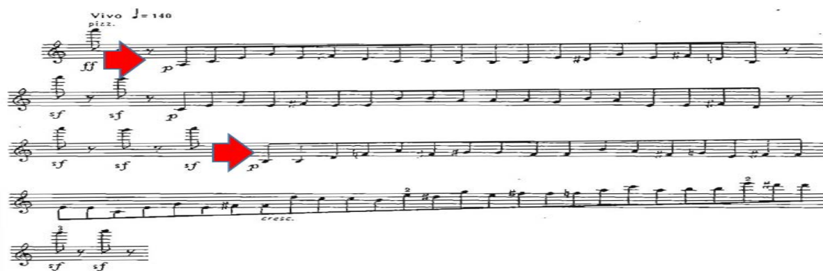
Рис. 1. Тематичний (перший) елемент першого розділу

І епізод – багаторазові повторення мало-секундної інтонації на ладовій складовій – тон «g» у pizzicato (ліва рука) – функція остинато. Звучання скрипки g-moll важ-