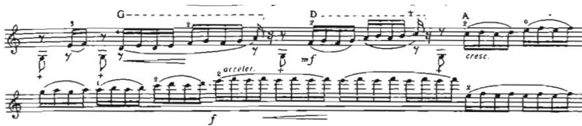
Рис. 9. Четвертий розділ. Кінцівка четвертого розділу