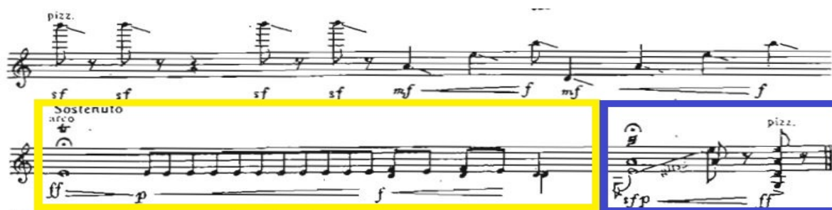
Рис. 11. Останній акорд

секунді «f – e») та інтервальним співзвуччям (опорні тони «a – e») (рис. 10).