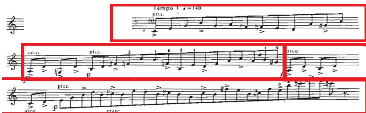
Рис. 8. Четвертий розділ. Початок. Уривок плачу