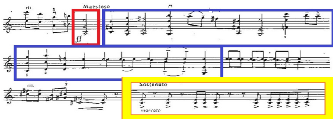
Рис. 7. Третій розділ. III епізод. Maestoso