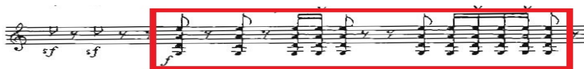
Рис. 2. Інтервально-ритмічна група першого розділу