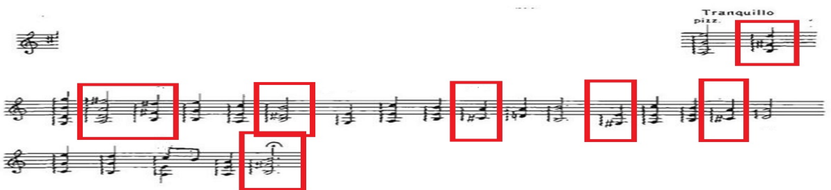
Рис. 5. Третій розділ. I епізод – Tranquillo . Моменти прояснення

II епізод третього розділу – pi mosso animato , наступна фаза розвитку рецитації (звучання на секту вище, підвищення градусу експресії, збільшення метричного кількісного дроблення нот, починаючи з восьмої тривалості до тридцять другої). Спостерігається емоційне напруження звучання, яке переходить до високого регістру, тим самим розкриваючи пронизливість мелодії (рис. 6).