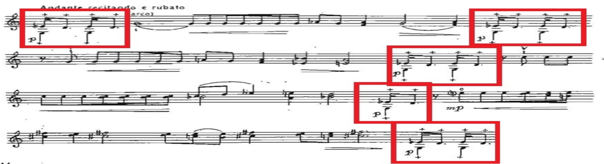
Рис. 4. Другий розділ. I епізод. Andante recitando e rubato

Третій розділ. I епізод – Tranquillo , зміна рецитації (акорди pizzicato ). Порівняно з I епізодом (низхідна секунда (мала) «e – d» середнього регістру II епізод має звучання на октаву вище й мелодико-емоційність засновується на секундні (великій) «e – d», момент прояснення базується на дієзних акордах (рис. 5).