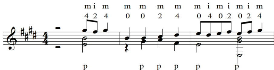
Рис. 3. Й. Бах Гавот № 2 мі мажор

же кроків виховувати вміння пов'язати нотні знаки зі слуховими уявленнями на гітарі – це зробить нотний запис живим, таким, що звучить. Під час читання необхідно, щоб студент схоплював осмислені музичні комплекси: «горизонтальні» – мелодичні побудови, спочатку найкоротші, а потім все більш подовжені; «вертикальні» – також спочатку найпростіші співзвуччя, а потім все складніші акорди» [3, с. 41]. У цьому контексті цінним є педагогічний прийом: «спільний розбір на уроці складних уривків із гітарних творів. Призначення спільного розбору – спрямувати подальшу самостійну роботу студента, що поступово розвиває навички розбору нотного тексту. Проте неприпустимо розбирати на уроці гітарний твір повністю» [4, с. 88].