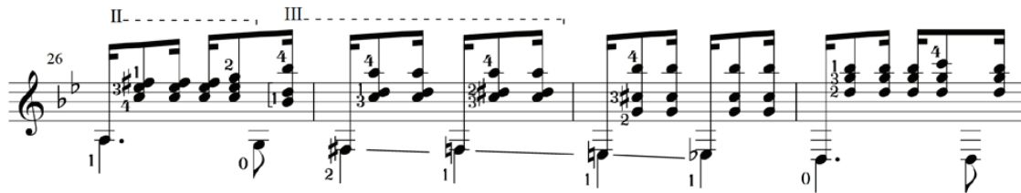
Рис. 4. А. Барріос Choro de Saudade (26-29 такти)

тися того, щоб він знав і розумів, чому застосована саме така аплікатура, а не будь-яка інша» [6, с. 320].