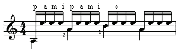
Рис. 1. Гітарне тремоло

Формування та удосконалення аплікатурного мислення гітаристів слід розглядати у контексті комплексного процесу професійної підготовки інструменталістів-виконавців. Зокрема важливо мислити не просто пальцями, а чути внутрішнім слухом майбутнє виконання. На думку В. Доценка «важливо з перших