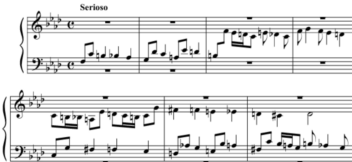
Рис. 7. Початок фуги