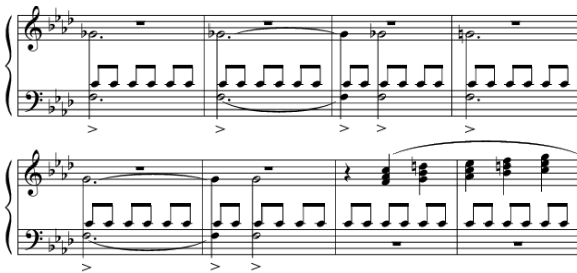
Рис. 4. Ритуальна трійковість

Наступний епізод (тт. 83–91) цікавий тим, що відіграє роль спогаду (рис. 5). Оскільки людська пам'ять ніколи не відтворює події минулого з абсолютною точністю, музична структура тут представлена не у первісному вигляді, а в наближеному, трансформованому