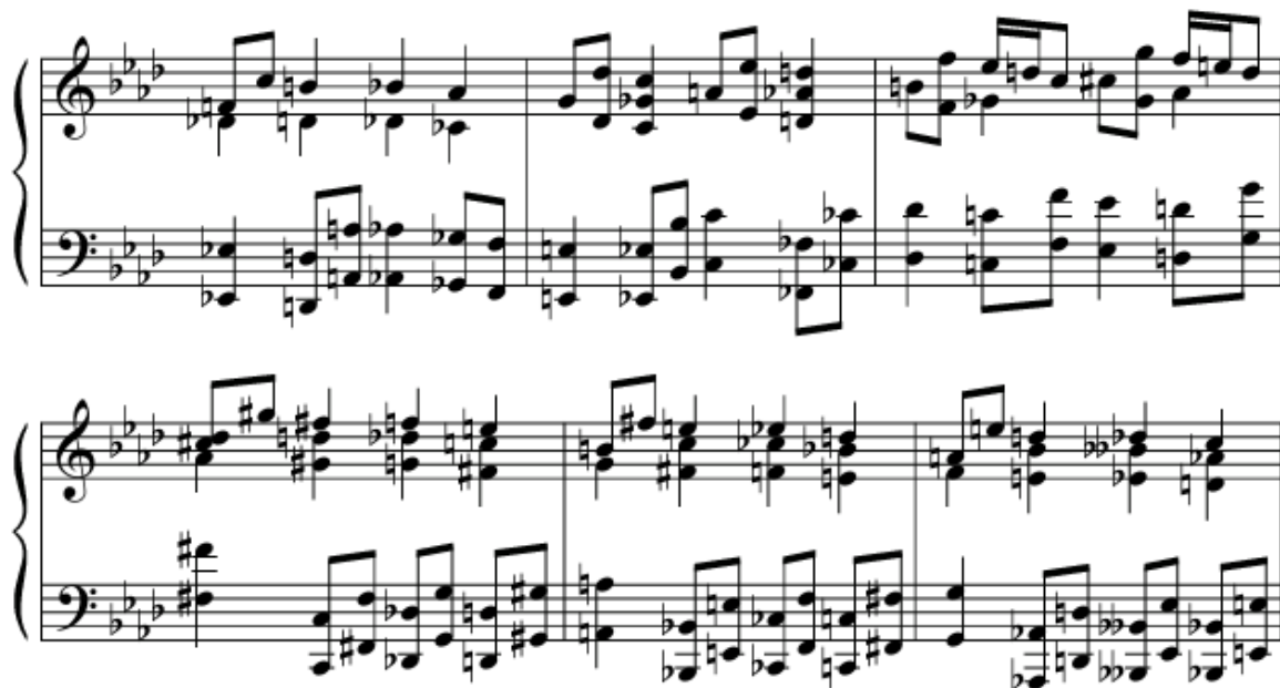
Рис. 8. ефект важкості Буття + символіка «трійки» у фугі

У такті 25 відбувається якісний зсув музичної реальності. Тема, проведена у верхньому голосі від до-бемоль, накладається на подвійно збільшений варіант теми в головній тональності. Задерацький навмисно деформує час – прийом подвійного збільшення розтягує час до невпізнання, «повільний» та «швидкий» час існують одночасно, формуючи акустичну модель травматичної свідомості, у якій звичний лінійність руйнується, подія у минуле не відходить, а залишається