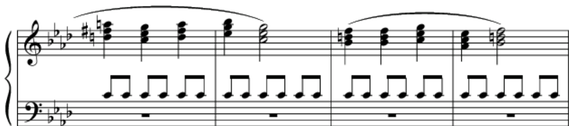
Рис. 5. Спогад