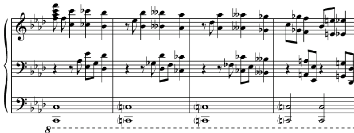
Рис. 9. Онтологічна вісь Буття

Фінальний розділ фуги (тт. 45–55) вибудований як зона максимальної акустичної щільності монолітної звукової маси. Останнє октавне проведення теми в басу октавами (тт. 45–47) створює ефект голосу землі, а октавно-акордове дублювання теми в партіях обох рук (тт. 48–55), що йде слідом, формує феномен