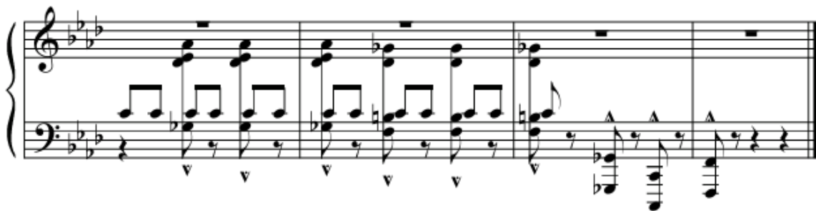
Рис. 6. Фінал прелюдії

Фуга (рис. 7) значно поглиблює міфічно-казковий простір, окреслений у прелюдії. На це вказує й позначка Serioso , що в даному творі виходить за межі традиційної інтерпретації строгості темпу чи характеру. У контексті хтонічно-сакрального простору, який був вибудований у прелюдії, ця ремарка означає передусім дисципліну духу. Лише аскетизм як форма існування Обраного та внутрішня зосередженість дозволяють не порушити сакральну межу між світами, а навпаки – увійти в хтонічний простір. У цьому сенсі Serioso функціонує як охоронний код: він не дозволяє музичній тканині