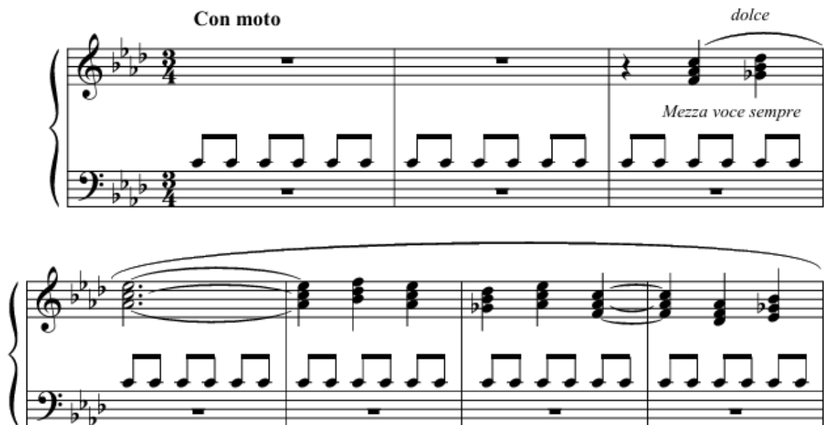
Рис. 1. Всвидяче око та хор тіней

проте, одночасно, викликають глибоке співчуття, адже стережуть поріг та утримують межу між світом живих і світом мертвих. Кемпбелл [18] вважав, що хтонічна символіка виражає життєві цикли смерті і відродження, підкреслюючи універсальні трансформації людської психіки.