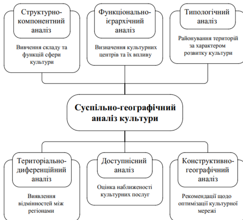
Рис. 1. Основні напрями суспільно-географічного аналізу сфери культури

Поліфункціональні культурні центри концентрують різнорівневі заклади, кадровий потенціал і високий рівень культурної активності. Регіональні культурні вузли поєднують обслуговуючі й спеціалізовані функції, виступаючи проміжною ланкою між ядром і периферією. Локальні культурні осередки забезпечують переважно базові культурні послуги, але можуть мати окремі унікальні спеціалізації. Периферійні території культурного дефіциту характеризуються недостатньою інфраструктурною забезпеченістю, слабкою кадровою базою та низькою подієвою інтенсивністю. Окремий тип формують території спадщинно-символічної концентрації, де навіть за обмеженої сучасної інфраструк-