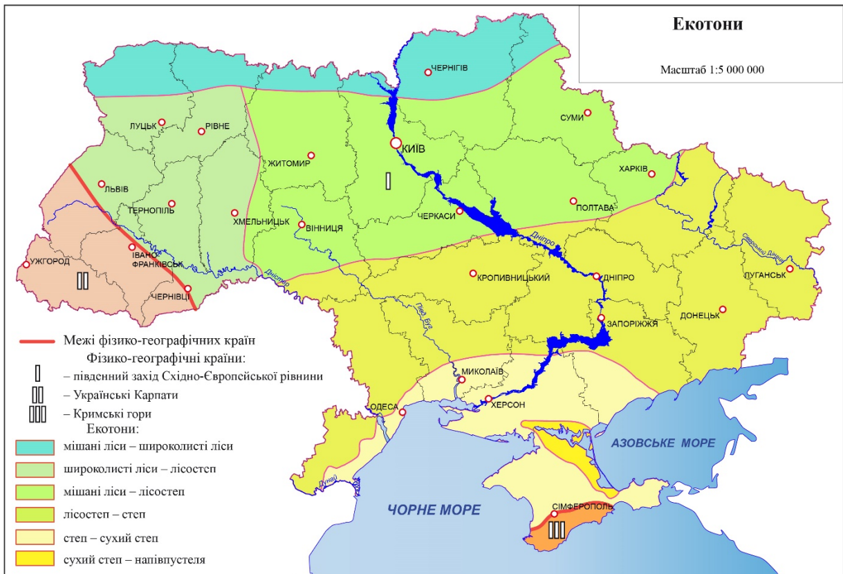
Рис. 1. Екотони на території України