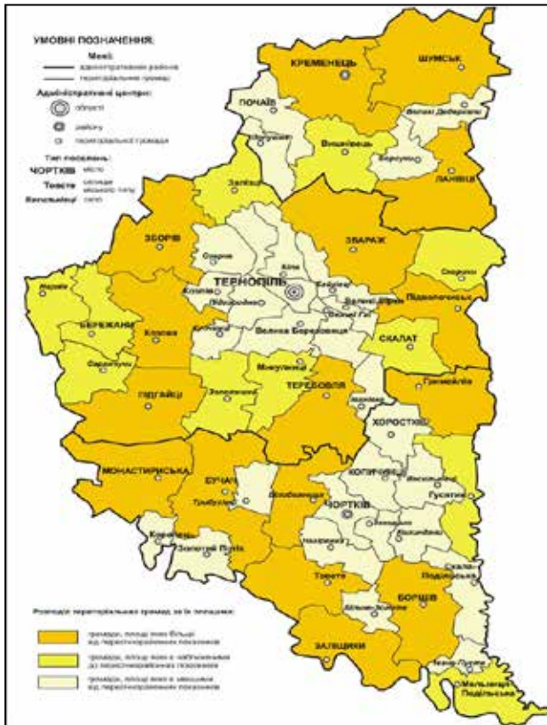
Рис. 1. Розподіл територіальних громад Тернопільської області за їхніми площами