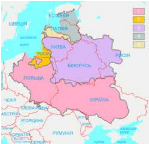
Рис. 4. Річ Посполита напередодні Хмельниччини на тлі сучасних державних кордонів Цифрами позначені: 1 – власне Польща, 2 – Пруссія (ленні землі Польщі), 3 – Литва, 4 – Лівонія (ленні землі Польщі та Литви), 5 – Курляндія (ленні землі Польщі та Литви)

ення ними «клинів» більшою мірою нагадував американський – фермерський, ніж прусський – юнкерський.