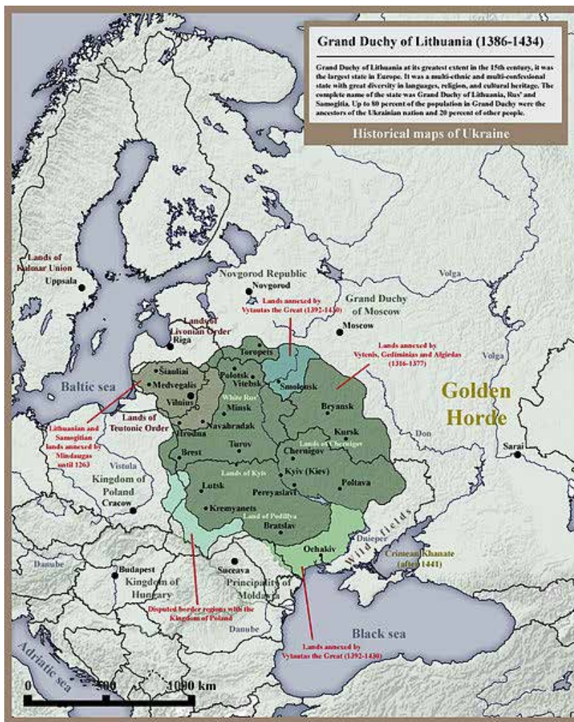
Рис. 3. Велике Князівство Литовське на тлі сучасних державних кордонів

українців деяку протизаги втраченим північно-східним територіям, які контролювала Давня Русь. По-друге, українська колонізація степових ландшафтів змінила самий характер Степу як людського простору – він став значно краще організованим, з кочівного перетворився на селянсько-козацький (служив у певному поєднанні потребам ведення господарства та оборони). Родючі ґрунти – чорноземи звичайні, поширені в північностеповій підзоні, стали в пригоді для хлібороба.