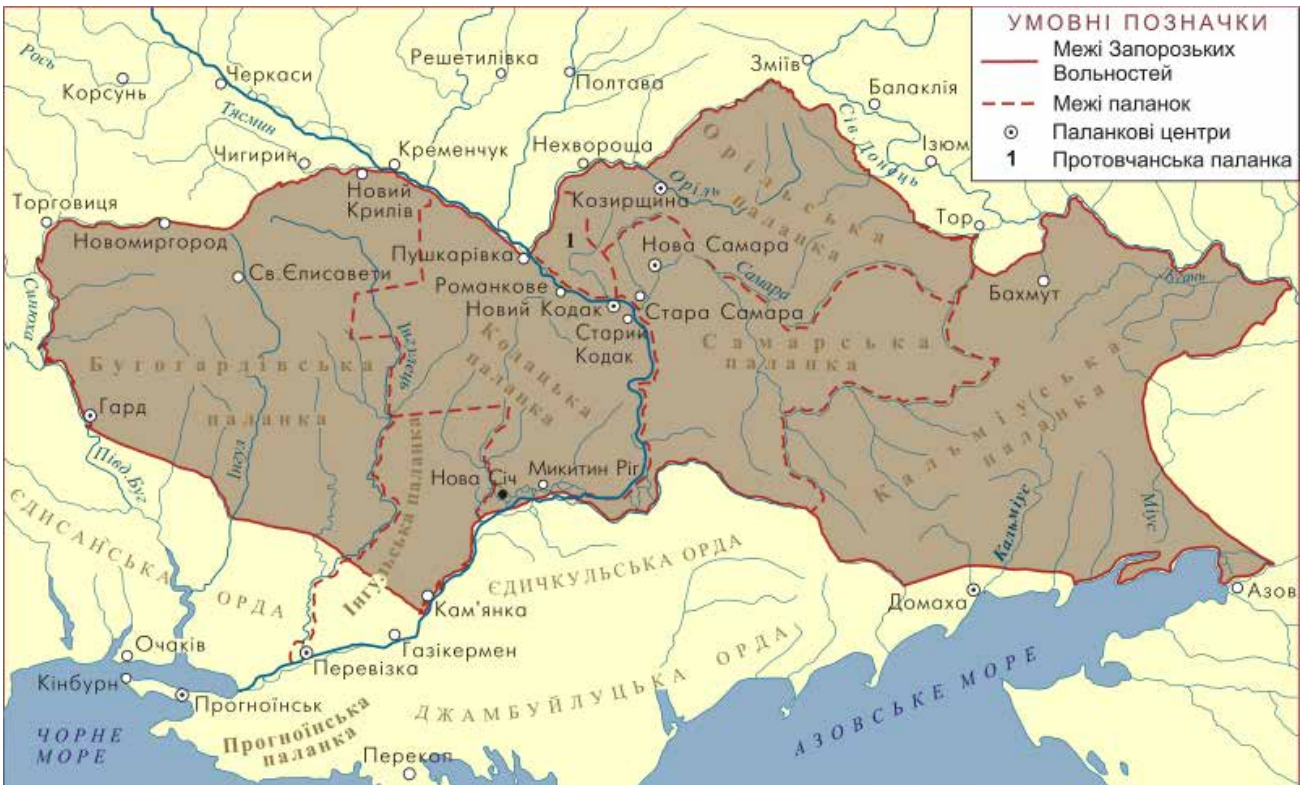
Рис. 5. Територія Вольностей Запорозьких [5]

XX сторіччя, на відміну від попереднього йому, в аспекті формування території України позначилося відновленням її державної території. Попри поступове звуження етнічної території, викликане, передовсім, значною асиміляцією українців на теренах російської федерації, починаючи з 1930-х рр., наявність державної території в 1991 р. стала остаточною реальністю. При цьому необхідно відзначити, що ця територія стала приблизно в півтора рази вужчою порівняно з територією Української держави 1918 р. [9]. Документальним свідченням тому є низка карт, створених упродовж