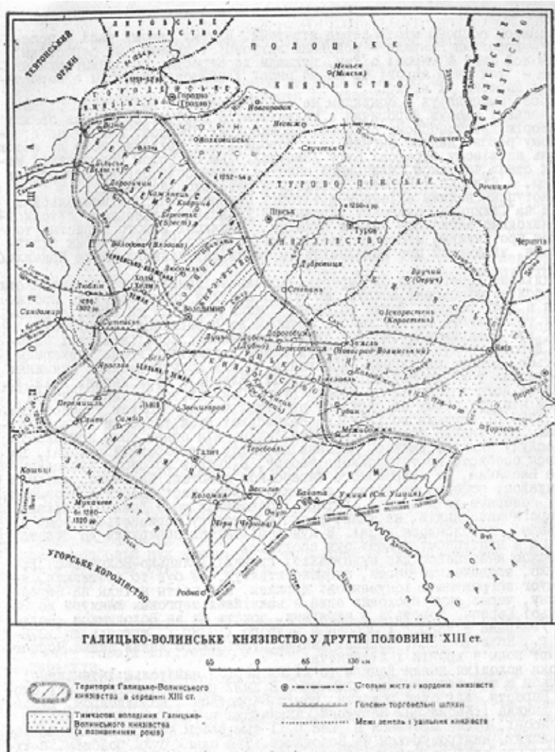
Рис. 2. Українські землі у складі Галицько-Волинської держави (XIII ст.) [3]

Якщо ранній (доби класичного Середньовіччя) етап формування української державної території розглядати з позицій геософічного підходу, то слід наголосити на північно-східному векторі експансії за старокиївських часів та зосередженості на захід-південно-західному напрямі за Галицько-Волинської держави. Сама по собі орієнтованість на схід характеризує експансію як таку, тоді як відсунуте на захід положення є, на нашу думку, ознакою деякої звуженості українського простору.