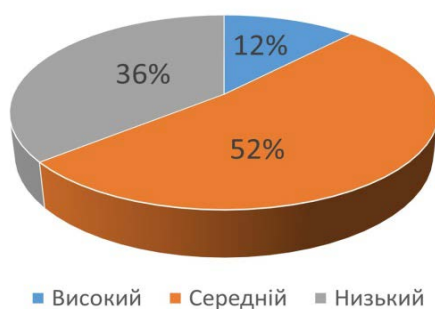
Рис. 2. Рівні умінь і навичок учнів використовувати у власному мовленні речень різних типів

Узагальнені дані дозволили зробити висновок, що уміння і навички учнів використовувати у власному мовленні речення різних типів перебувають на середньому рівні (рис. 2).