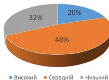
Рис. 4. Рівні умінь і навичок учнів використовувати у власному мовленні різних типів речень