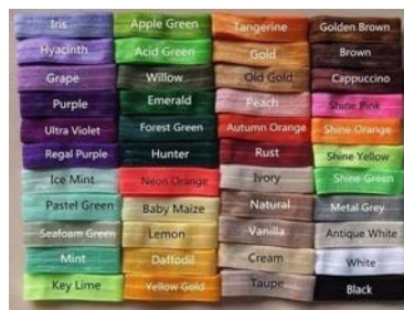
Рис. 2. Кольорова палітра

З метою концентрації уваги на нюансах значення доцільно подавати учням комбіновані візуально-вербальні опори. Так, для вивчення кольорових відтінків пропонується рисунок «Кольорова палітра», за яким учні можуть виконувати різноманітні завдання: утворення словосполучень або рядів лінійної деривації, називання кольорів предметів тощо (див. рис. 2).