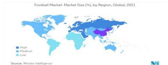
Рис. 6. Рівень участі у футболі в усьому світі

Рейтинги старших національних збірних і результати останніх чемпіонатів світу з футболу яскраво демонструють тенденцію до зростання дисбалансу в національному футболі (рис. 6).