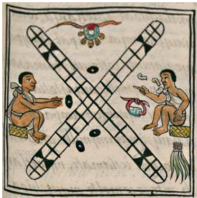
Рис. 8. Зображення ацтеків, які грають в патоллі

У Флорентійському кодексі присутня сцена, де Сіпактональ і Ошомоко, ацтекські світові прабатьки, які ототожнюються з Ішмукане і Ішпійакоок народу мая, винаходять календар. На малюнку Ошомоко трясє в руках кілька бобів. Вона асоціюється з визначенням долі світу й окремих місць через гру. Покровителем гри був бог Макуільшочітль. Грали в «патоллі» зазвичай удвох або вчотирьох. У кожного з гравців були ігрові «фішки» певного кольору (зазвичай червоного, білого, чорного та блакитного) у кількості п'яти (рідше шести) штук. Гра проходила на ігровому полі хрестоподібної