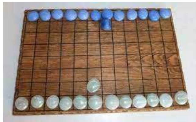
Рис. 10. Комплект для гри Ludus latrunculorum (сучасна реконструкція)

Першу письмову згадку про latrunculi залишив римський енциклопедист Марк Теренцій Варрон (116–27 рр. до н. е.) у книзі De Lingua Latina . Згадував про гру і Ісидор Севільський (560/570–636), відомий адепт латинської патристики, в енциклопедії «Етимологія». «Латрункулі» була дуже популярною грою, з неї проводились інтелектуальні турніри в містах Стародавнього Риму. Гра мала численні варіації як і самих правил, так і розмірів дошки. Класичні правила гри передбачали суперництво на дошці з 8 x 12, 7 x 8, 8 x 8 квадратами і 16 чи 32 фігурами, які нагадували сучасні шашки. У грі з'являлася дамка, якщо проста фігура досягала останньої лінії ігрового поля, яка мала умовну назву «ріка». Прості ходили в чотирьох напрямках, але не по діагоналі (як у сучасних шашках). Якщо проста була оточена із чотирьох боків, тобто не могла зробити хід, вона знімалася