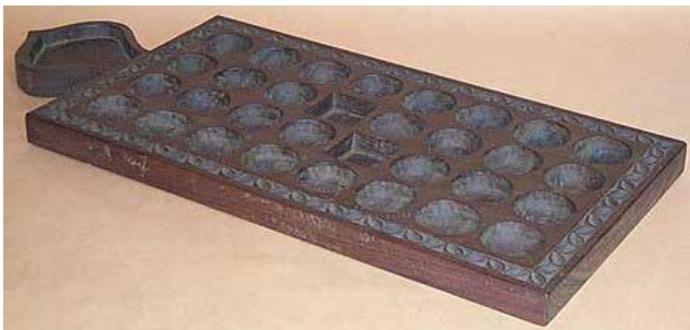
Рис. 6. Дошка для популярної на Занзібарі гри «бао» – різновиду «манкали»

Після розповсюдження в Африці мусульманства вказана група інтелектуальних розваг отримала назву «манкала», яка походить від арабського слова naqala , що дослівно перекладається як «переміщати». Але збереглися й автохтонні назви ігор цього сімейства, які часто походять від назв предметів, інвентарю або дій, які здійснюють гравці. Наприклад, від слова mbao мовою суахілі («дошка») походять назви «бао» і «амба», а від michezo ya mbao («гра на дошці») – «омвесо». «Варі» означає «будинок» (слово «будинок» використовується замість слова «лунка»). В ігри «манкала» грають зазвичай двоє учасників. Класичні правила ігор трактують так: кожному гравцю належить ряд із шести лунк і більша лунка – «калах» (комора) праворуч від нього, де збираються виграні фішки. Для початку обидва опоненти розкладають по шість фішок у кожену маленьку лунку. По черзі гравці беруть усі фішки з будь-якої своєї маленької лунки й розкладають їх по одній у кожену