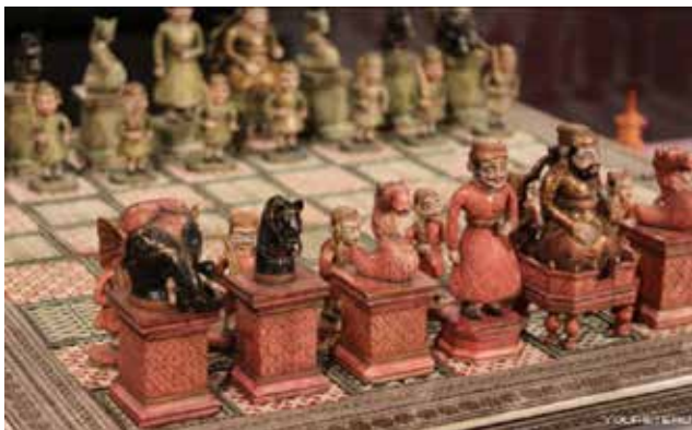
Рис. 7. Давньоіндійська версія фігурок для гри у чатурангу

Гра була популярною і за доби київських князів, про що свідчать археологічні знахідки в Тмутаракані, Білій Вежі, Києві, Вишгороді, Городні, Новгороді й інших руських містах. Вік і географія знахідок указує на те, що шахи проникли до України-Русі у X–XI ст. з південного сходу, а саме із Хазарії, і впродовж століття поширилися аж до Новгороду та Балтійського моря. До Хозарського Каганату гра мігрувала торговими шляхами від арабів через територію сучасного Азербайджану та Дагестану.