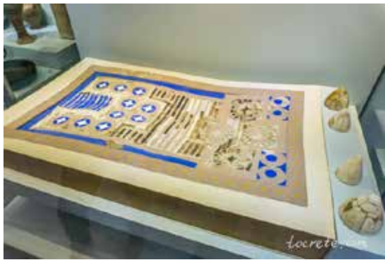
Рис. 2. Дошка для гри у 20 квадратів із Криту, експонат археологічного музею в острівному місті Іракліон

Згодом «Царська гра Ура» набула релігійного контексту і гравці вважали, що під час поєдинку гра демонструє їхнє майбутнє або передає послання від небожителів. «Асеб» залишалася популярною до Пізньої Античності, коли перетворилася на ранню форму нардів або була витіснена ними. Згодом її забули практично всюди, за винятком поселень кочинських євреїв (найстаріших представників юдейського народу в Індії, що історично мешкали на півдні штату Керала), які продовжували грати в неї до початку масової еміграції до Ізраїлю в 1950-х роках. Правила гри станом на II століття до н. е. частково відомі завдяки виявленій у Вавилоні гли-