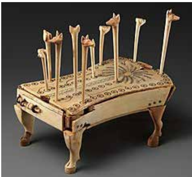
Рис. 4. Дошка для гри « пси і шакали » з ебенового дерева (1814–1805 роки до н. е.) – експозиційний матеріал музею Метрополітен (Сполучені Штати Америки)

На жаль, деталізувати правила гри на сьогодні не має жодної можливості. Завдяки позначкам і підписам на дошках можна встановити, що гра передбачала якісь