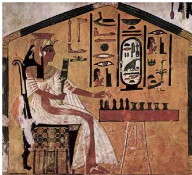
Рис. 1. Перша дружина фараона Рамзеса II Великого цариця Нефертарі Меренмут (1298–1235 рр. до н. е.) грає у «сенет»

гав той гравець, чиї фігурки в повному складі першими залишали площину фінішного 30-го квадрата, розташованого в нижньому правому куті дошки. Квадрати з 26 по 29 були прикрашені символами, які мали особливе значення. Можливо, вони дозволяли фігурці зробити «зайвий крок» або, навпаки, змушували пропустити хід. Зображення «сенет» можна знайти в похованнях від додинастичного періоду (IV тисячоліття до н. е.) до некрополів XIX династії єгипетських фараонів, династичне правління яких скінчилося 1186 роком до н. е.