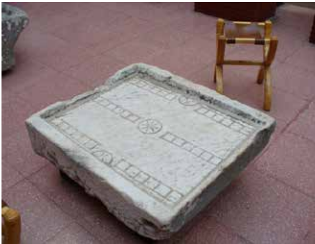
Рис. 9. Дошка для гри Ludus duodecim scriptorum в археологічному музеї міста Ефес

Ludus duodecim scriptorum та «табула» – ігри, які були популярні в Римській імперії. У 2014 році археологи підтвердили їх існування, виявивши на території Туреччини настільну гру, вік якої становить приблизно 2,5 тис. років. Гра відома під назвою Ludus duodecim scriptorum , або XII scripta – «гра з 12 відмітками» (рис. 9). Дослідники зізналися, що мають не так багато інформації про неї, проте вони припустили, що XII scripta призначалася для двох гравців. Ця гра – попередниця «табули», яка, зі свого боку, стала базою для сучасних