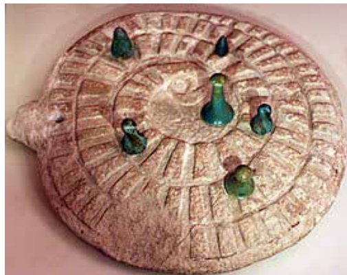
Рис. 3. Гральний комплект для «мехен» (III тис. до н. е.)

Існує думка, що дошка для «мехен» мала астрономічні ознаки, фактично була уособленням місячного або сонячного календарем, за яким визначали придатні для сільськогосподарських робіт дні. Опис гри можна зустріти у єгипетських писемностях та в «Книзі мертвих». Інколи «мехен» використовували під час різних обрядів і ритуалів.