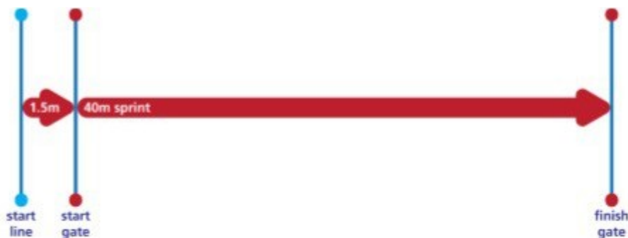
Рис. 1. Схематичне зображення тесту повторної спринтерської здатності

Сучасному футбольному арбітру потрібно постійно розвивати свої теоретичні знання, адже футбол не стоїть на місці. IFAB (Міжнародна рада футбольних асоціацій) – це футбольний орган, що складається із чотирьох членів від ФІФА (Міжнародної федерації футболу) та чотирьох британських футбольних асоціацій (Англій, Шотландії, Уельсу та Північної Ірландії). Цей орган є відповідаль-